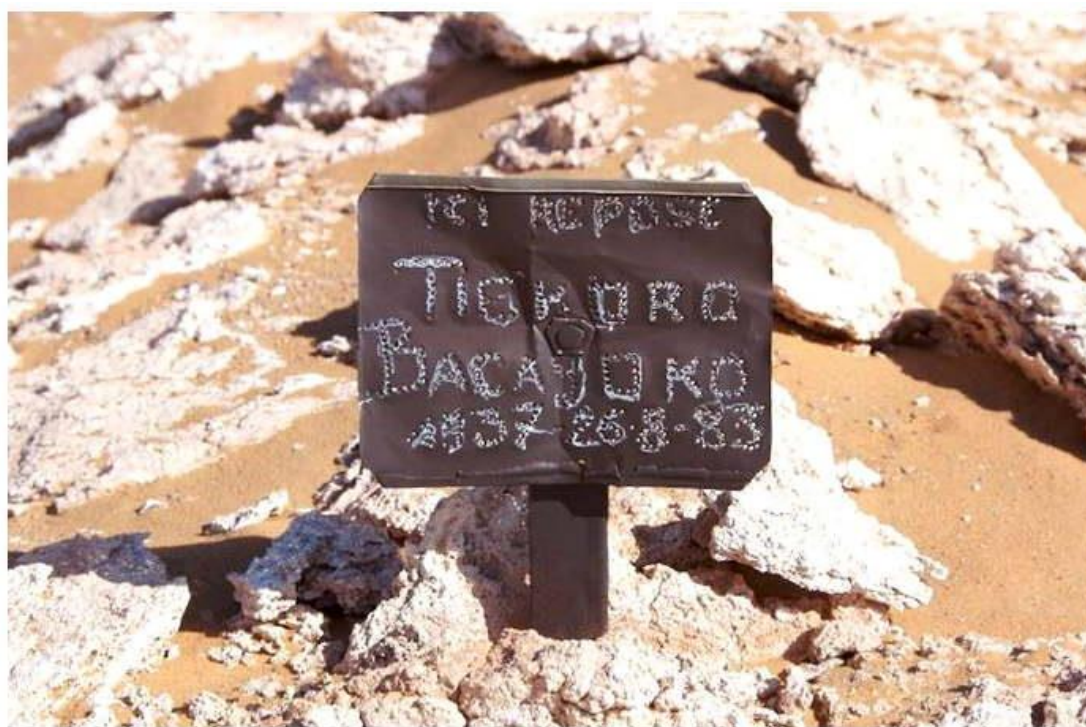
Фото: Wieland Schmidt. 2007. www.mali-nord.de