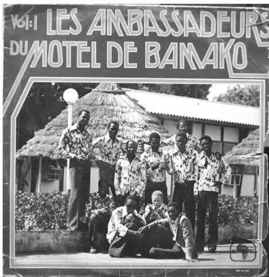
Обложка диска группы Les Ambassadeurs du Motel